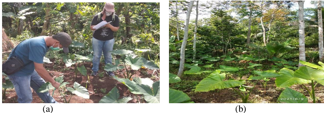
Gambar 2. Talas beneng pada pola (a) monokultur dan (b) agroforestry Figure 1. ( Taro beneng on monoculture pattern (a) and agroforestry pattern (b) )