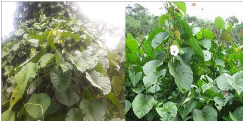
Gambar 5. Merremia peltata (L.) Merrill Figure 5. Merremia peltata (L.) Merril

perennial berbatang teguh dengan daun membulat, dapat tumbuh memanjat hingga ketinggian 30 m (Gambar 5). Merupakan jenis asli dari Afrika Timur dan menyebar sampai dengan ke wilayah Asia dan Pasifik.