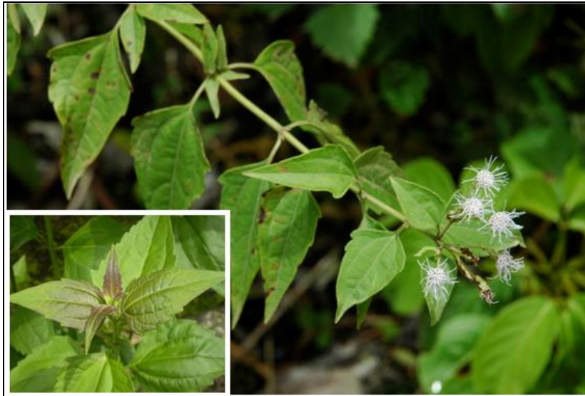
Gambar 3. Chromolaena odorata (L.) R. M. King & H. Rob Figure 3. Chromolaena odorata (L.) R. M. King & H. Rob

merupakan tumbuhan perennial yang biasanya berbunga pada musim kering (Gambar 3). Kirinyuh diketahui tumbuh dengan baik di tempat yang mendapat cukup cahaya, terutama di daerah terbuka, padang rumput, tepi-tepi perkebunan dan hutan.