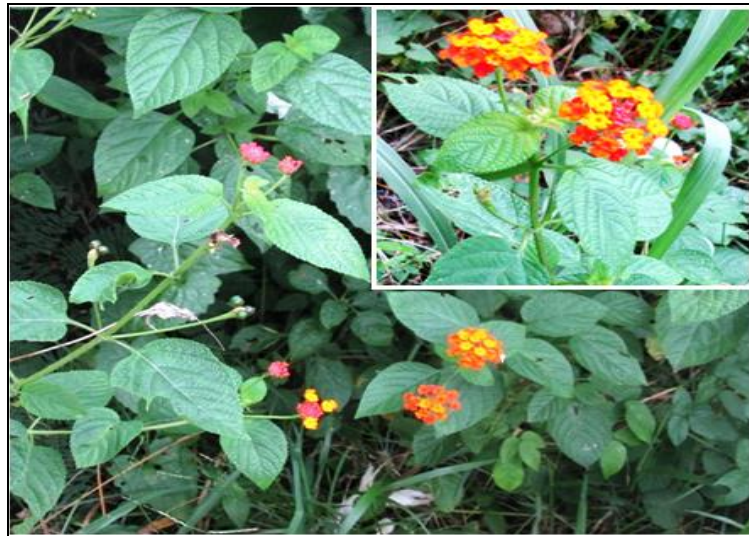
Gambar 4. Lantana cammara L. Figure 4. Lantana cammara L.