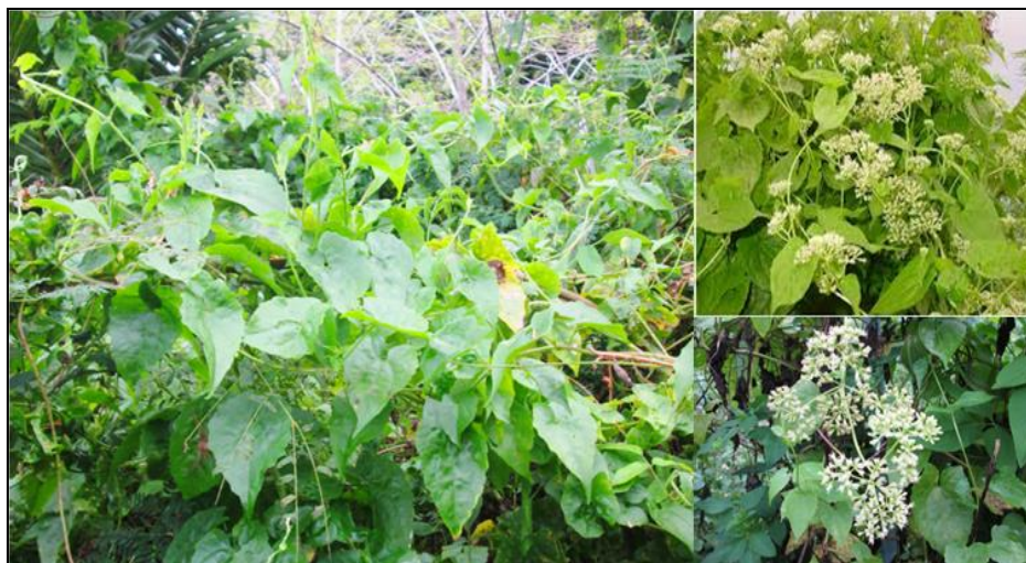
Gambar 6. Mikania micrantha Figure 6. Mikania micrantha

Individu muda tumbuhan ini mampu tumbuh cepat dalam waktu singkat, menggunakan pepohonan sebagai tempat merambatnya, kemudian segera menutupi tumbuhan penyokongnya. Jenis ini diketahui merupakan jenis asli daerah Amerika Selatan yang telah menyebar ke seluruh dunia dan dikenal sebagai tumbuhan invasif di daerah-daerah terbuka sekitar perkebunan dan hutan di seluruh Indonesia. Catatan mengenai kehadiran jenis ini di Papua telah diketahui sejak awal tahun 2000-an, dijumpai pula tumbuh di Tahura Dr. Moh Hatta, Padang, Sumatera Barat, Tahura Sultan Thaha Saifuddin, Jambi, Taman Hutan Pendidikan dan Penelitian Biologi (HPPB) Universitas Andalas (Nursanti, 2018; Sahira, M., 2016; Solfiyeni, 2015; Waterhouse, 2003).