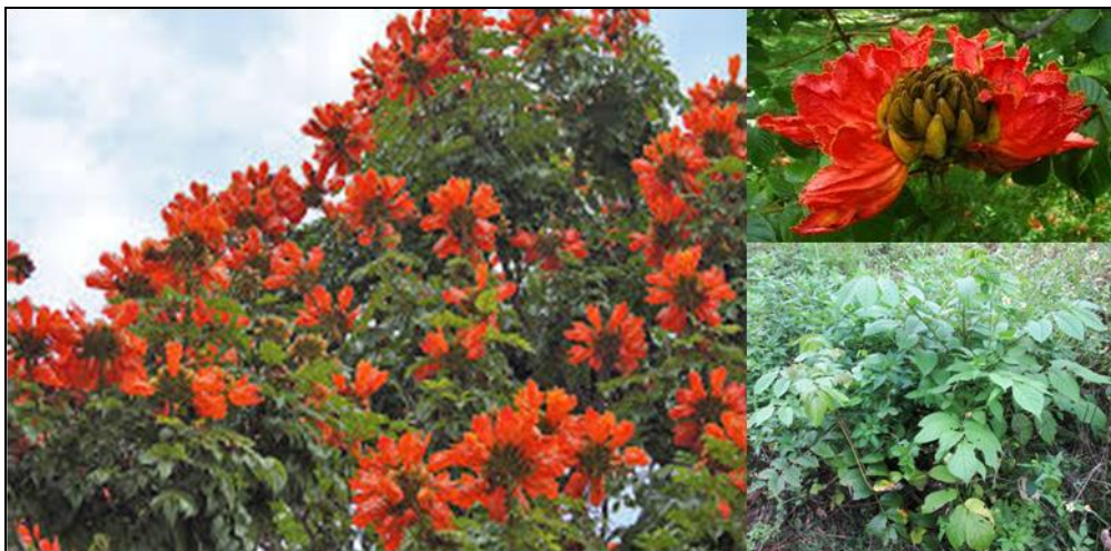
Gambar 7. Spathodea campanulata P. Beauv.

berasal dari famili Asteraceae dan famili Fabaceae. Famili Asteraceae dikenal memiliki banyak anggota yang berbentuk semak, liana, hingga pohon dan memiliki kemampuan dispersal yang sangat luas dengan biji yang mudah menyebar dengan bantuan angin, atau dibantu oleh hewan dan manusia. Jenis-jenis Asteraceae sangat mudah menginvasi suatu ekosistem alami terutama dimulai dari bagian tepi ekosistem dan daerah-daerah yang telah terkena pengaruh manusia (Hodkinson D; Thompson K, 1997; Westcott, D.& Dennis, n.d.; Zimdahl, 2007). Sebagai tambahan, meskipun penghitungan dominasi jenis dan pendugaan populasi tidak dilakukan untuk mengukur tingkat invasibilitas atau menduga resiko jenis-jenis invasif ini terhadap kawasan, perkiraan terhadap resiko invasi hanya dilakukan berdasarkan ciri-ciri umum dari famili tumbuhan yang dominan saja, didukung dengan informasi dari literatur terkait.