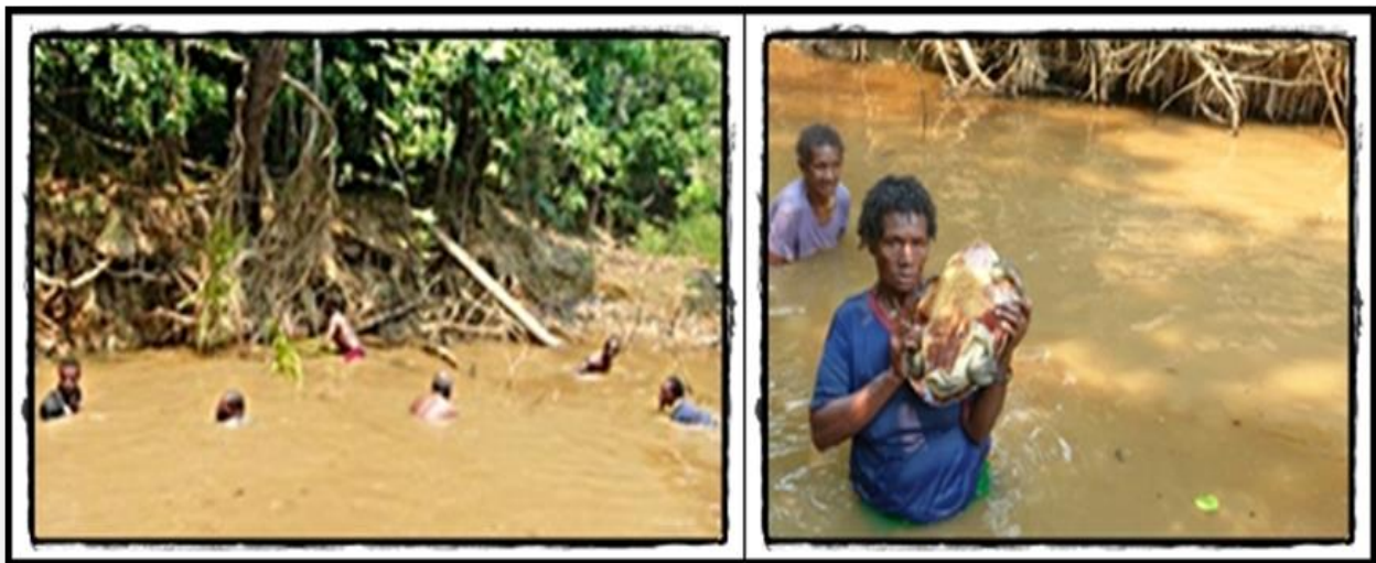
Gambar 1. Pencarian dan penangkapan kura-kura di kali Sardago, Rawa Dung, Distrik Jair, Merauke Figure 1. Searching and catching Tortoise in Sardago River, Rawa Dung, Jair Distric, Merauke

debit air rawa sedang surut. Penangkapan dengan cara ketiga biasanya dilakukan pada kondisi debit air rawa sedang tinggi, dimana dalam kondisi seperti ini cara 1 dan 2 sulit untuk dilakukan (masih tergenang). Salah satu cara penangkapan kura-kura secara tradisional (cara 1) di alam dapat dilihat pada Gambar 1.