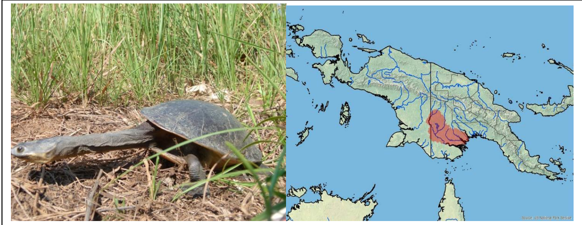
Gambar 3. Jenis dan Sebaran Chelodina parkeri Figure 3. Type and Distribution Chelodina parkeri

sedangkan dari wilayah Indonesia hanya di wakili 1 kampung saja yaitu Kp Mutimanggi.