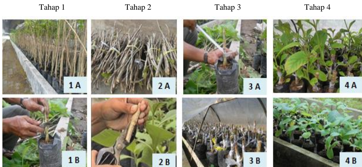
Gambar 1. Tahapan pembuatan bibit okulasi jati di persemaian

Pembuatan bibit secara okulasi dilakukan di persemaian sebagaimana metode yang dilaporkan dalam penelitian sebelumnya (Pudjiono & Adinugraha, 2013; Sulaeman, 2014; Suwandi & Adinugraha, 2016). Adapun tahapan kegiatan pembuatan okulasi jati tersebut disajikan pada Gambar 1 dengan rincian kegiatan yang dilakukan adalah sebagai berikut: