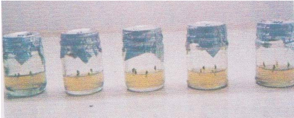
Gambar (figure) 1. Eksplan yang ditanam pada media M 5 0 ( Explants were planted on MS0 medium )