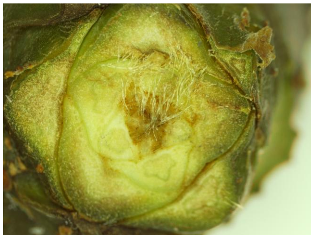
Gambar 1 ( Figure 1 ). Irisan melintang tunas generatif tanaman suren ( Transverse section of generative bud of suren )

Pengamatan ini dilakukan terhadap tunas-tunas generatif dan vegetatif. Pada awalnya tunas yang terbentuk hampir sama bentuknya tetapi tunas yang akan menjadi bunga setelah dilihat dibawah mikroskop dengan pembesaran 40 X akan terlihat seperti dalam Gambar 1 berikut ini.