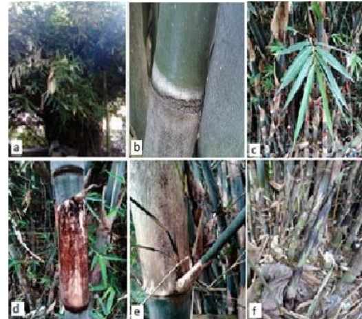
Gambar (Figure) 3. G. apus .

Deskripsi: Perawakan perdu, tinggi 8-15 m, diameter 3,15-4,10 cm, 10-63 individu per rumpun. Akar rimpang polimorf dan memiliki akar udara. Batang lurus, menyutera tersebar merata, tipis, hitam. Percabangan 1 cabang bagian tengah lebih besar dari 4-5 cabang lain, mulai muncul pada ruas