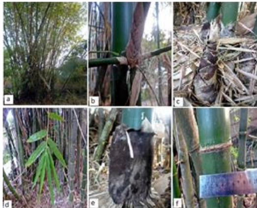
Gambar (Figure) 6. B. vulgaris

Keterangan: (a). rumpun ( clumps ), (b). percabangan ( branching ), (c). rebung ( bamboo shoots ), (d). daun ( leaves ), (e). pelepah batang ( stemp midrib ), (f). buku batang ( stemp sections )