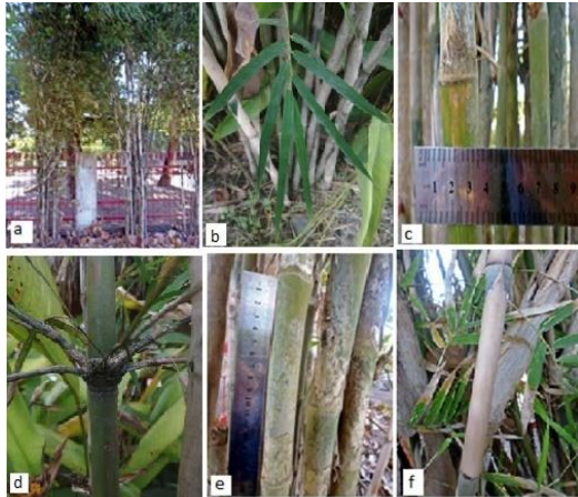
Gambar (Figure) 2. T. siamensis .

Keterangan (Remarks): (a). rumpun ( clumps ), (b). daun ( leaves ), (c). lebar batang ( stemp width ), (d). percabangan ( branching ), (e). ruas batang ( stemp sections ), (f). pelepah batang ( stemp midrib )