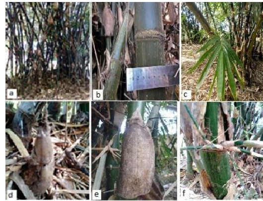
Gambar (Figure) 5. B. maculata ,

Deskripsi: Perawakan perdu, tinggi 20-23 m, diameter 4,50-6,17 cm, 86-150 individu per rumpun. Akar rimpang polimorf, akar udara muncul sampai ruas ke 2. Batang tegak, menyutera putih keabu-abuan, tersebar jarang. Percabangan hampir sama besar 3-5