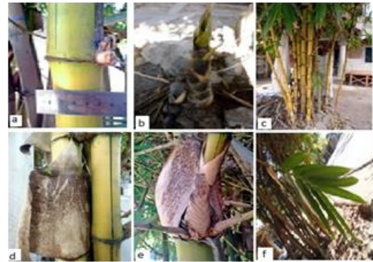
Gambar (Figure) 7. B. vulgaris var. vittata

Deskripsi: Perawakan perdu, tinggi 11-12 m, diameter 3,30-4,22 cm, 20 individu per rumpun. Akar rimpang memiliki akar udara yang tumbuh sampai buku 2-3. Ruas batang berwarna