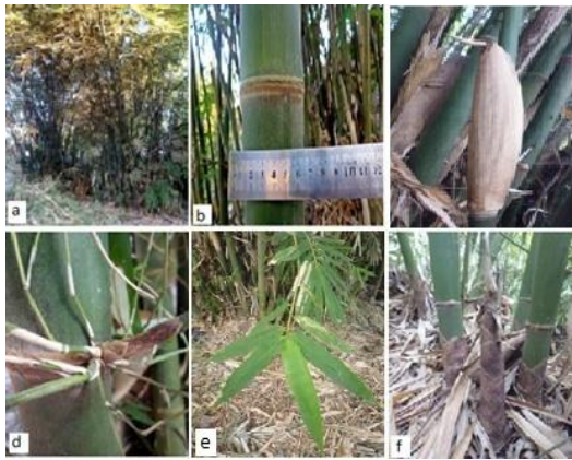
Gambar (Figure) 4. G. atter .

Keterangan: (a). rumpun ( clumps ), (b). buku batang ( stems sections ), (c). pelepah batang ( stemp midrib ), (d). percabangan ( branching ), (e). daun ( leaves ), (f). rebung ( bamboo shoots )