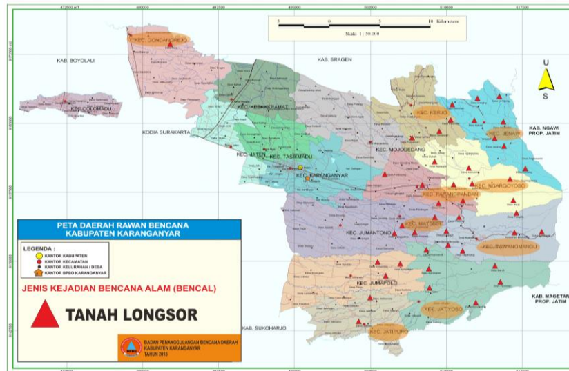
Gambar (Figure) 1. Peta Daerah Rawan Bencana Kabupaten Karanganyar (Map of Disaster-prone Areas of Karanganyar Regency)