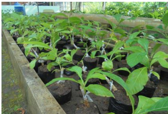
Gambar 3. Bibit hasil okulasi jati umur 3 bulan di persemaian

Penggunaan rootstock yang beragam asalnya meskipun spesies yang sama dapat menyebabkan variasi keberhasilan tumbuh bibit hasil okulasi. Selanjutnya untuk memperoleh pertumbuhan bibit yang optimal, maka faktor lingkungan seperti temperatur, intensitas cahaya matahari, ketersediaan air dan unsur hara pada media harus diperhatikan (Hartmann et al., 2010; Kumar, 2011). Oleh karena itu bibit jati hasil okulasi (Gambar 3) harus dipelihara secara rutin yang meliputi penyiraman, penyiangan, pemupukan, penjarangan bibit dan pemberantasan hama/penyakit.