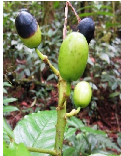
Gambar 2 (b). Buah E. horsfieldii