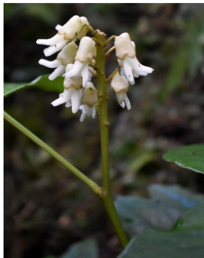
Gambar 3. Bunga E. horsfieldii

Berdasarkan pengalaman para pengguna, misalnya dalam upaya mengobati rematik, terdapat beberapa perbedaan dalam meracik ramuan E. horsfieldii . Pertama menggunakan ramuan yang berasal dari beragam bahan yakni daun E. horsfieldii , tiga butir beras ( Oryza sativa ), daun turi ( Sesbania grandiflora ), sambiloto ( Andrographis paniculata ), dan sembilan butir buah kemiri ( Aleurites moluccana ). Sementara itu, teknik yang lain adalah murni menggunakan tumbuhan E. horsfieldii , namun dengan mengambil dari seluruh bagian tanaman yakni akar, batang, daun (muda), dan tiga buah biji E. horsfieldii .