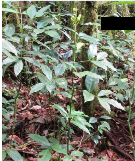
Gambar 2 (a). E. horsfieldii